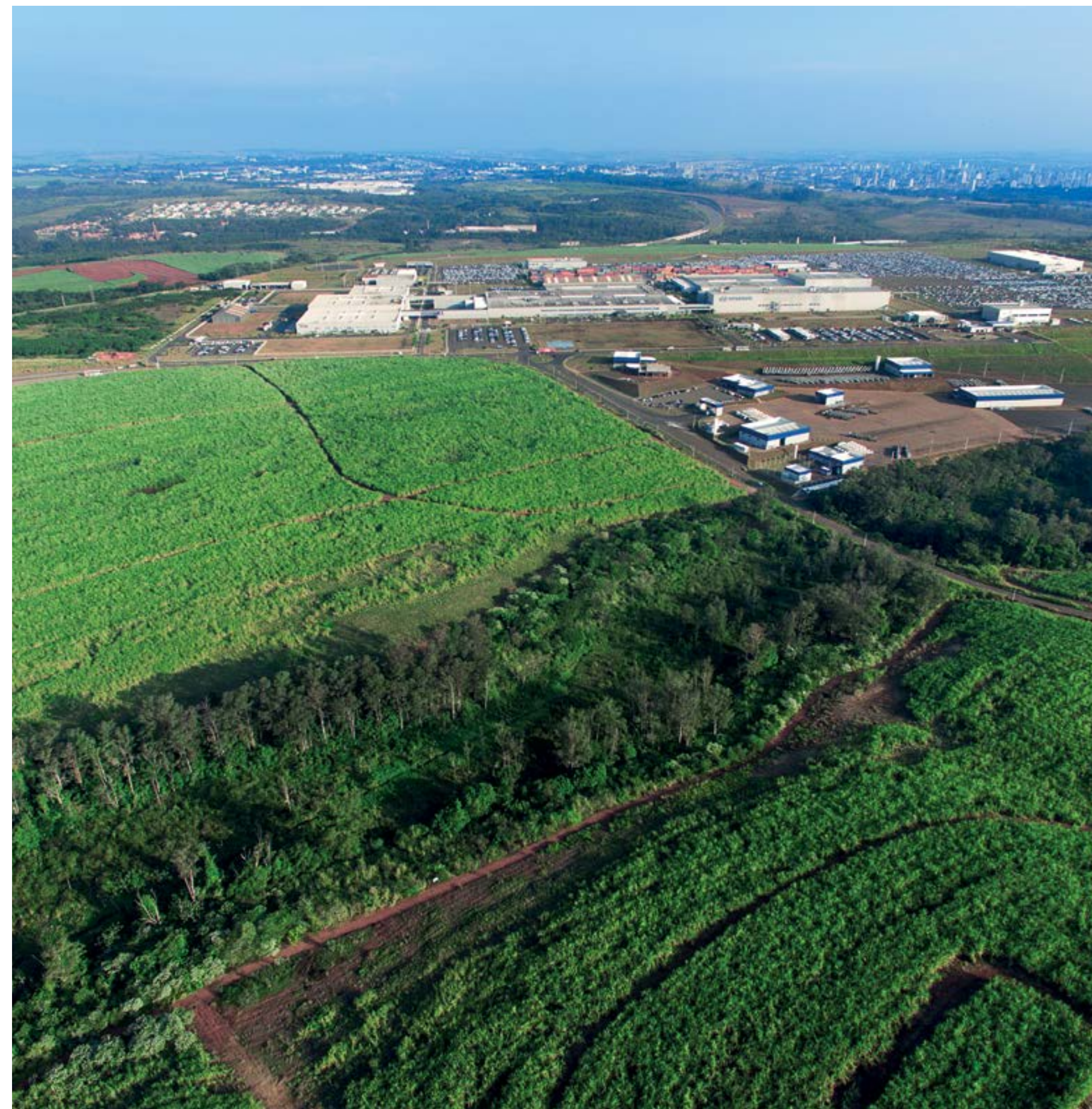
A Hyundai plantou 48 mil mudas de espécies nativas próximo à fábrica em Piracicaba, alcançou a meta “aterro zero” e não envia resíduos para aterros sanitários.