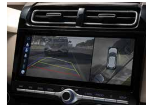
Smart Camera 360°