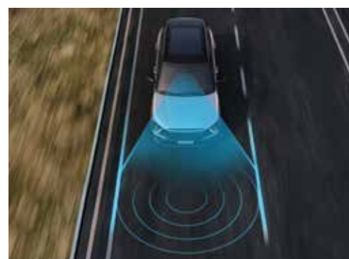
Assistente de Permanência em Faixa