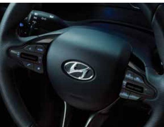
Comandos no volante