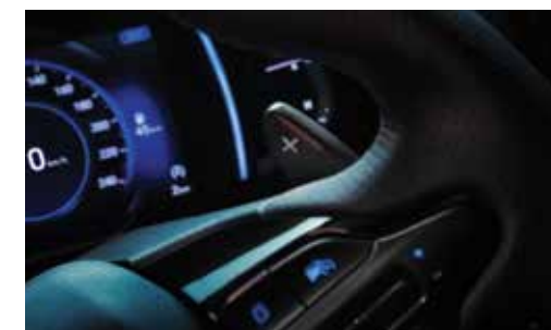
Alavancas no volante para trocas de marcha com mais segurança e esportividade