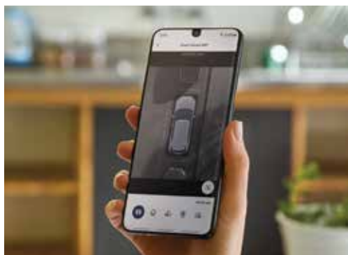
Visão 360° no aplicativo