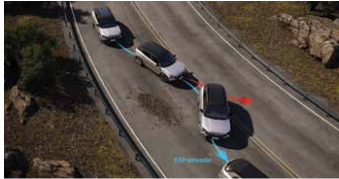
Controle de tração (TCS) e estabilidade (ESP)