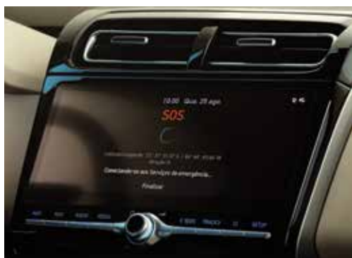
Assistência 24 horas por dia, nos 7 dias da semana