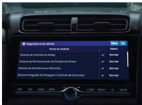
Diagnósticos do seu CRETA N Line