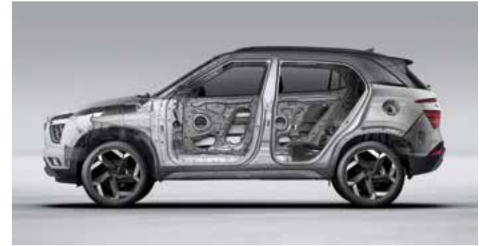
Estrutura de aço de ultrarresistência