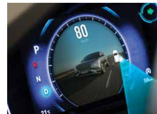
Câmera para Monitoramento de Ponto Cego