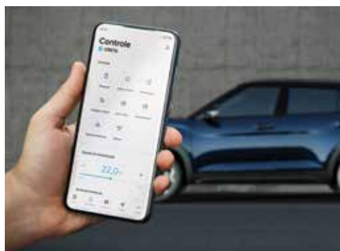
Comandos remotos e status do seu CRETA N Line