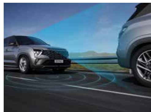
Sistema de Frenagem Autônoma