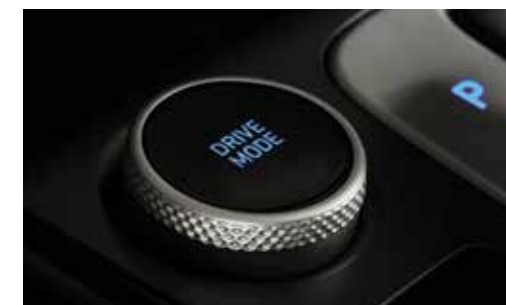
Seleção de modo de direção

Sport - Direção mais esportiva que prioriza mais torque e potência.