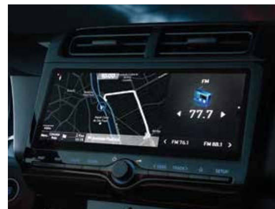
Central multimídia blueNav® de 10,25"

Central multimídia blueNav® com Bluelink Com tela touchscreen de 10,25", GPS integrado, conexões USB e Bluetooth®, comandos no volante, além de conectividade com smartphones pelo Google Android Auto e Apple CarPlay®. Acesse os principais recursos do seu smartphone por meio de comandos na central multimídia ou por comandos de voz de maneira segura, sem perder o foco na direção.