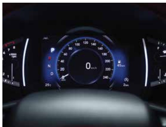
Painel digital colorido Supervision Cluster de 7"